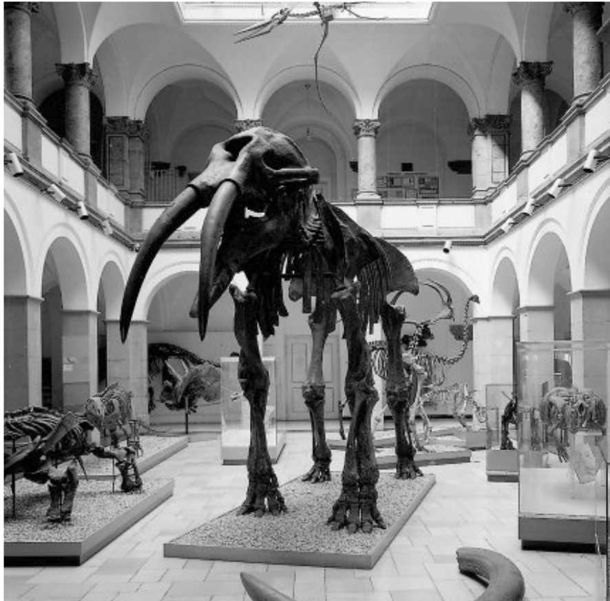
Lichthof mit Ausstellungsbereich

Die Planungen erfolgten eng mit der Ludwig-Maximilian-Universität München, der Feuerwehr und den beteiligten Lehrstuhlinhabern.